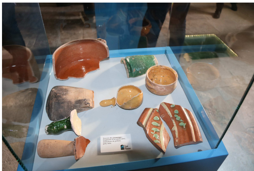
Des objets retrouvés dans les latrines